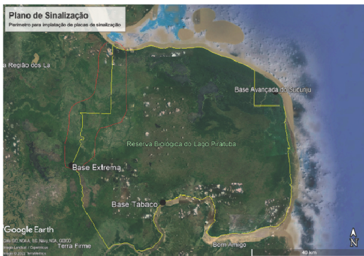
Figura 2 - Localização da REBIO do Lago Piratuba